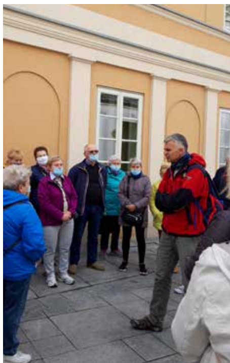
Zajęcia UTW Siewierz