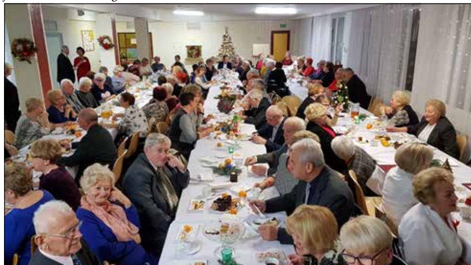
Spotkanie opłatkowe (2018 r.)

można powiedzieć, że mieliśmy szczęście rozpocząć naszą działalność w okresie w miarę spokojnym. Jako Prezes doceniam społeczną pracę wszystkich członków Zarządu pierwszej oraz drugiej kadencji i dziękuję im za zaangażowanie, a także owocną współpracę. Dziękuję też naszym Studentom za ak-