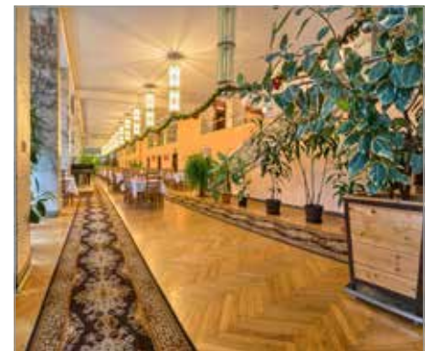
↑ Nowe Łazienki Mineralne i Patria w Krynicy-Zdroju