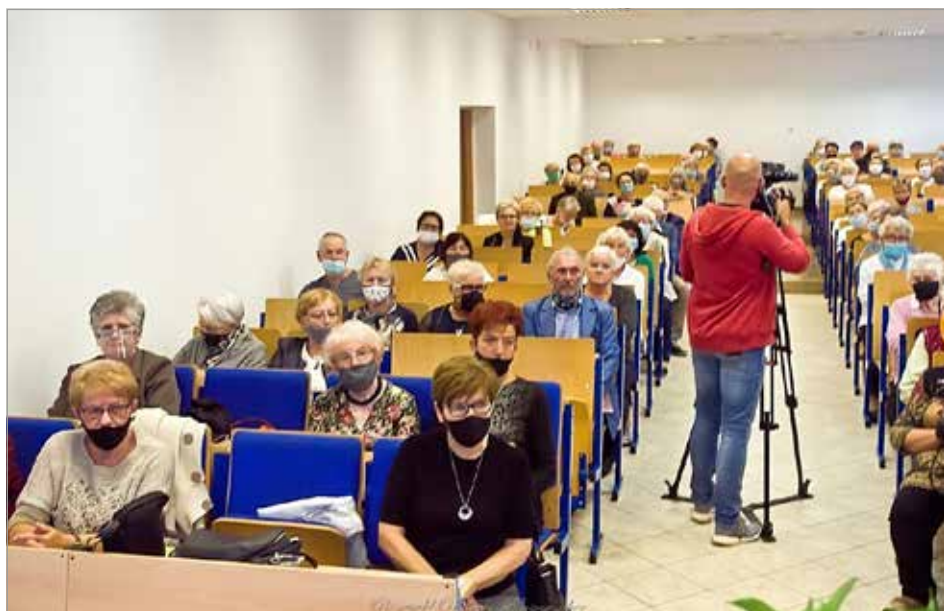
Zajęcia UTW przy WSBiP w Ostrowcu Świętokrzyskim