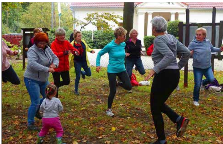
Inauguracja Roku Akademickiego na świeżym powietrzu