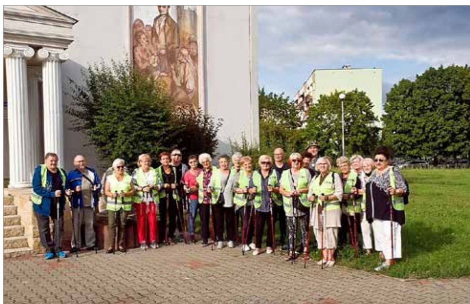
Grupa Nordic Walking

krzyskiego, ogółem 180 osób. Były to zadania publiczne: