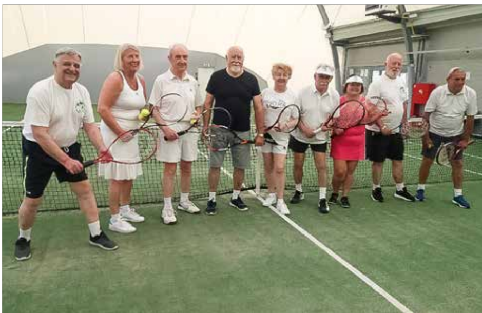
Zajęcia z tenisa ziemnego

nia odbyła się również, od dawna planowana i oczekiwana wycieczka „Perełki Wschodniej Polski” oraz turnus wypoczynkowy w Ustroniu Morskim. Z pozostałych wyjazdów musieliśmy zrezygnować.