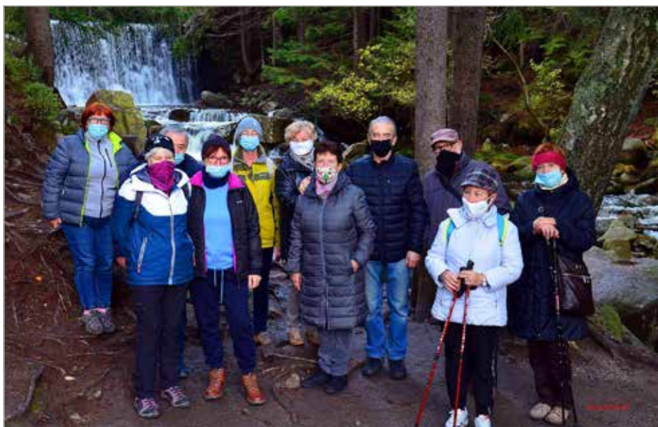
Pobyt w Karpaczu

Żar. Sekcja fotograficzna również spotykała się w terenie.