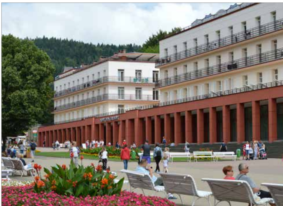
Nowy Dom Zdrojowy w Krynicy-Zdroju, fot. archiwum UKŻ SA

W trakcie ostatnich 12 miesięcy sanatoria w Polsce zamykane i otwierane były już kilkakrotnie, za każdym razem na nieco innych zasadach. Wspomnieć tutaj trzeba, że