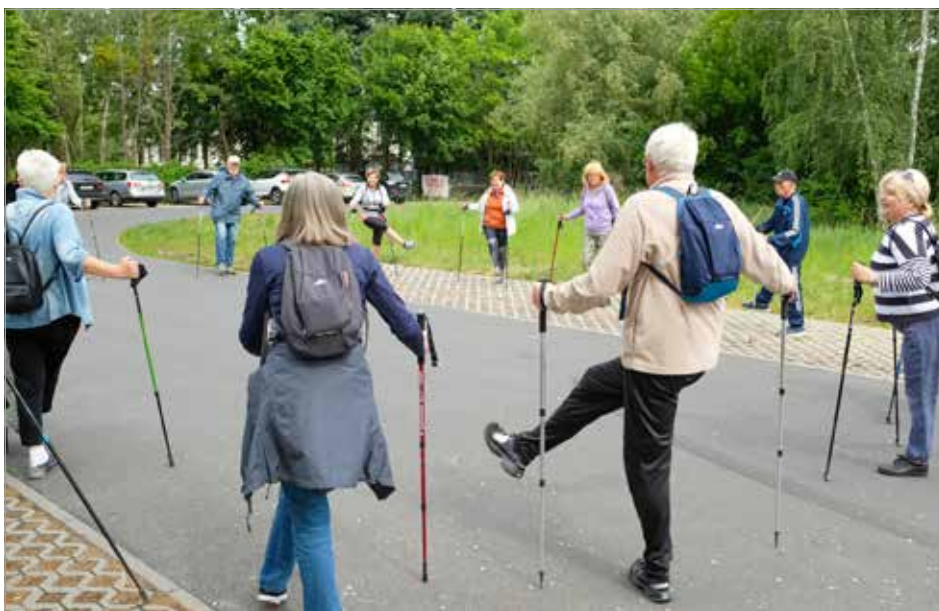
Grupa Nordic Walking

W późniejszym niż zwykle terminie, bo dopiero w sierpniu, w zastrzonym reżimie sanitarnym odbyło się Walne Zgromadzenie Członków Uniwersytetu Trzeciego Wieku w Tarnowie Podgórny. Niestety, musieliśmy odwołać lipcowe, jak i sierpniowe, tak wyczekiwane półkolonie dla seniorów Gminy Tarnowo Podgórne. Zarząd, korzystając ze sprzyjającej pogody, spotkał się „pod chmurką”, jak co roku z Jubilatami, którzy w ciągu roku 2020 kończyli 70, 80 i 85 lat. Dla niektórych z nich, z powodu zaostżeń sanitarnych, była to jedyna możliwa forma obchodów urodzin w dość licznym gronie. Na przełomie sierpnia i wrześ-