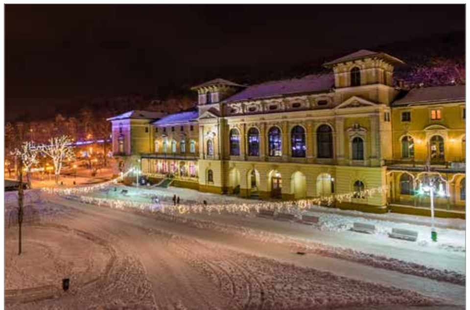
↓ Stary Dom Zdrojowy w Krynicy-Zdroju