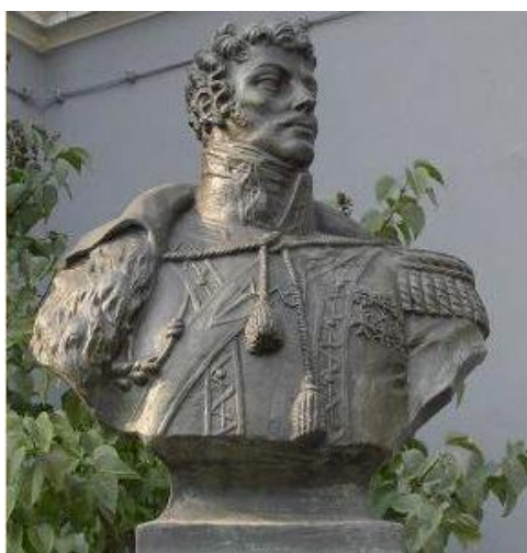
wzór popiersia Jana Koziatulskiego

Jan Koziatulski - symbol brawury, fantazji, ogromnej odwagi i wielkiej przyjaźni z Napoleonem - dla społeczności Skierniewic jest powodem do dumy. Dlatego zaszczytem będzie upamiętnienie jego osoby stosownym pomnikiem (popiersiem z brązu), który następnym pokoleniom będzie przypominał o bohaterskiej postawie i zasługach wielkiego skierniewiczana oraz o wspólnych dziejach polsko – francuskich.