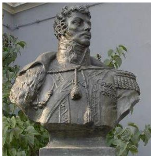
modèle du monument de Jan Koziatulski

C'est donc une question d'honneur de commémorer ce grand homme en érigeant sa sculpture sous forme d'un buste en bronze qui rappellera aux générations futures l'héroïsme et les mérites de ce fils de Skierniewice et l'histoire commune des Polonais et des Français.