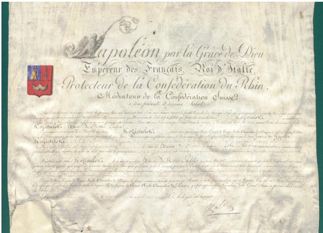
Diplôme d'attribution par l'Empereur Napoléon du titre de baron de l'Empire de France au colonel Jan Koziatulski, le 26 avril 1811

Les habitants de Skierniewice sont fiers de Jan Koziatulski, symbole de bravoure, de fantaisie, d'un énorme courage et d'une profonde amitié pour Napoléon.